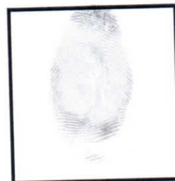
Impresión dactilar del notificado